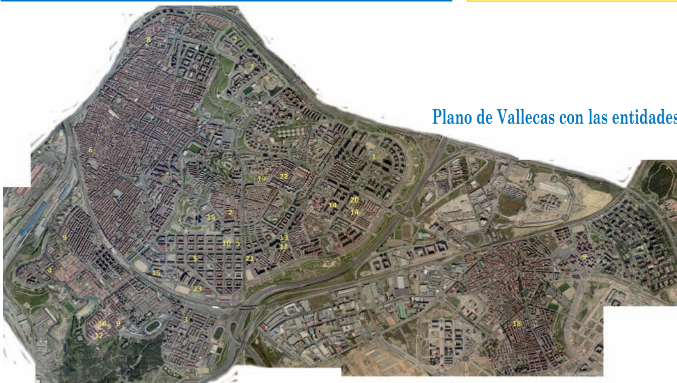
Plano de Vallecas con las entidades